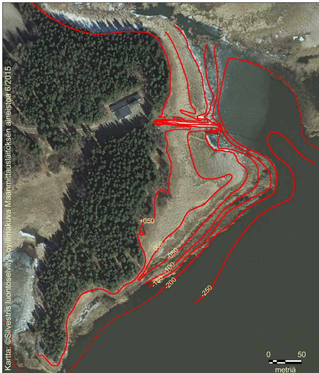
Kuva 2. Syvyyskäyrät ilmakuvapohjalla. Ruovikon ulkoreuna noudattelee suurin piirtein -200 cm syvyyskäyrää.